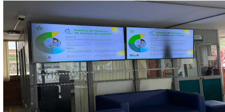
Capturas de pantalla de 24 de febrero 2026- Blog