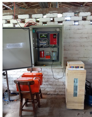
SISTEMA DE INCUBADURA SOLAR FOTOVOLTAICA